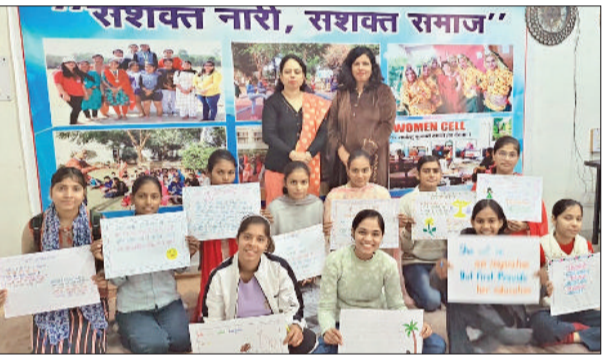
जीद। प्रतियोगिता में भाग लेती छात्राएं।