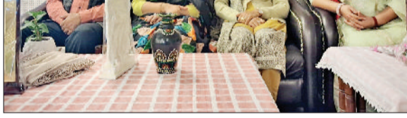
नरवाना। कार्यक्रम में भाग लेते हुए एस्टाफ।

एसडी महिला महाविद्यालय प्रांगण में सिरों के नौवें गुरु तेग बहादुर जी के 350वें शहीदी दिवस पर शहीदी गुरु को श्रद्धांजलि अर्पित करने के लिए एक कार्यक्रम का आयोजन किया गया। इस अवसर पर कार्यक्रम के मुख्य अतिथि लखविंदर पाल