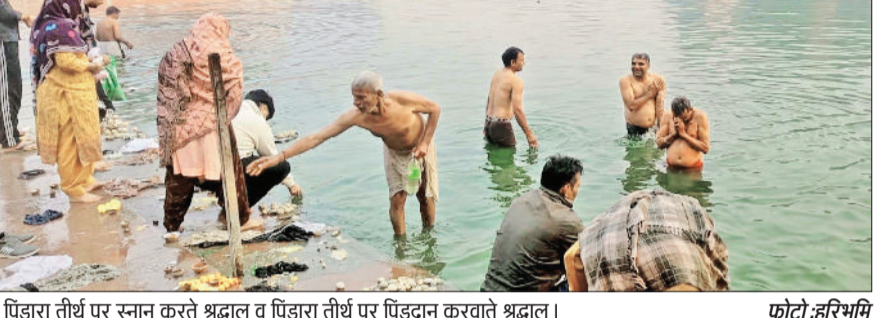
पिंडारा तीर्थ पर स्नान करते श्रद्धालु व पिंडारा तीर्थ पर पिंडदान करवाते श्रद्धालु।

शांति के लिए पांडवों ने यहां 12 वर्ष तक सोमवती अमावस्या की प्रतिक्षा में तपस्या की। बाद में सोमवती अमावस के आने पर युद्ध में मारे गए परिजनों की आत्मा की शांति के लिए पिंडदान किया। तभी से यह माना जाता है कि पांडु पिंडारा स्थित पिंडतारक तीर्थ पर पिंडदान करने से पूर्वजों को मोक्ष मिल जाता है। महाभारत काल से ही पितृ विसर्जन की अमावस्या, जगह लोगों ने सामान बेचने के लिए फड़े लगाई हुई थी। जिस पर बच्चों तथा महिलाओं ने खरीदारी की। बच्चों ने जहां अपने लिए खिलौने खरीदे तो वहीं बड़ों ने भी घर के लिए सामान खरीदे।