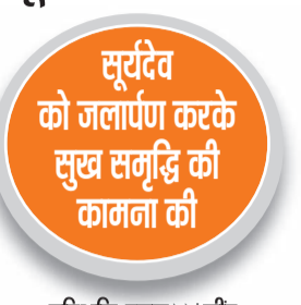
हरिभूमि न्यूज ▶▶ जीद

पूरी रात धर्मशालाओं में सत्संग तथा कीर्तन का आयोजन चलता रहा