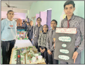
कैथल। कार्यक्रम में भाग लेते हुए विद्यार्थी।