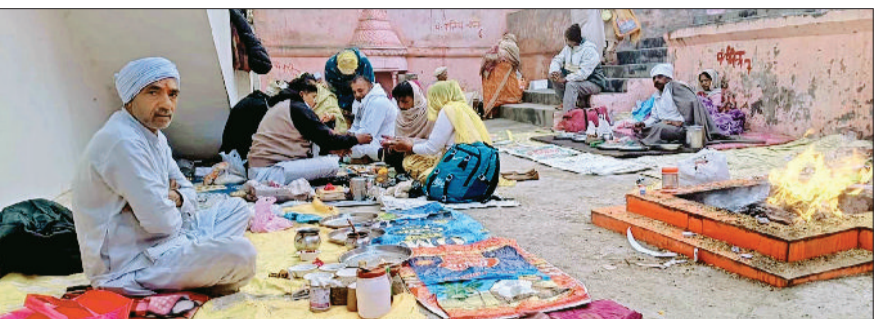
पिंडारा तीर्थ पर स्नान करते श्रद्धालु व पिंडारा तीर्थ पर पिंडदान करवाते श्रद्धालु।

मार्गशीष अमावस्या पर गुरुवार को महाभारतकालीन ऐतिहासिक गांव पांडु पिंडारा स्थित पिंडतारक तीर्थ पर लोग अपने पितरों की आत्मा की शांति के लिए पिंडदान करने के लिए पहुंचे। लोगों ने यहां पिंडदान करके करके तर्पण किया। ऐतिहासिक पिंडतारक तीर्थ पर बुधवार को शाम से ही श्रद्धालुओं का पहुंचना शुरू हो गया था। बुधवार की पूरा रात धर्मशालाओं में सत्संग तथा कीर्तन आदि का आयोजन चलता रहा। गुरुवार को तड़के से ही श्रद्धालुओं ने सरोवर में स्नान तथा पिंडदान शुरू कर दिया जो मध्याह्न के बाद तक चलता रहा। इस मौके पर दूर दराज से आए श्रद्धालुओं ने अपने पितरों की आत्मा की शांति के लिए पिंडदान किया तथा सूर्यदेव को जलापण करके सुख समृद्धि की कामना की। पिंडतारक तीर्थ के संबंध में किदवंती है कि महाभारत युद्ध के बाद पूर्वजों की आत्मा की