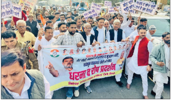
कैथल। नगर में प्रदर्शन करते कांग्रेसी नेता व कार्यकर्ता।