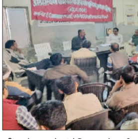
जीद। बैठक को संबोधित करते कर्मचारी नेता।

जुलाना। हांसी रोड स्थित भाजपा कार्यालय में हरियाणा सरकार के अंतर्गत आने वाला जीव रोजगार कार्यालय द्वारा निशुल्क पंजीकरण कैंप लगाया जाएगा। इस कैंप में शिक्षित बेरोजगार युवाओं का मुफ्त में रजिस्ट्रेशन करवाया जायेगा और इसके अलावा बेरोजगारी भत्ता देने वाली सरकार की सक्षम युवा योजना में आवेदन करने के लिये सरकारी कर्मचारियों द्वारा ट्रेनिंग भी दी जाएगी। युवाओं के लिए महत्वपूर्ण कैंप में जीद रोजगार कार्यालय से अधिकारी और कर्मचारी आयेगे। जो सुबह 10 बजे से लेकर तीन बजे तक बीजेपी कार्यालय में युवाओं के सहाय के लिये मौजूद रहेंगे। जनकारी के मुताबिक युवाओं को पंजीकरण के लिए शैक्षणिक योग्यता के सर्टिफिकेट, आधार कार्ड, जाति प्रमाण पत्र, निवास प्रमाण पत्र और पासपोर्ट साइज फोटो लाना अनिवार्य है। गौरतलब है कि हरियाणा सरकार 12वीं स्नातक और स्नातकोत्तर के युवाओं को 1200 से लेकर तीन हजार रुपये तक बेरोजगारी भत्ता देती है। इसके लिए पहले संपन्न में रोजगार कार्यालय में युवाओं को रजिस्टर्ड करना होता है।